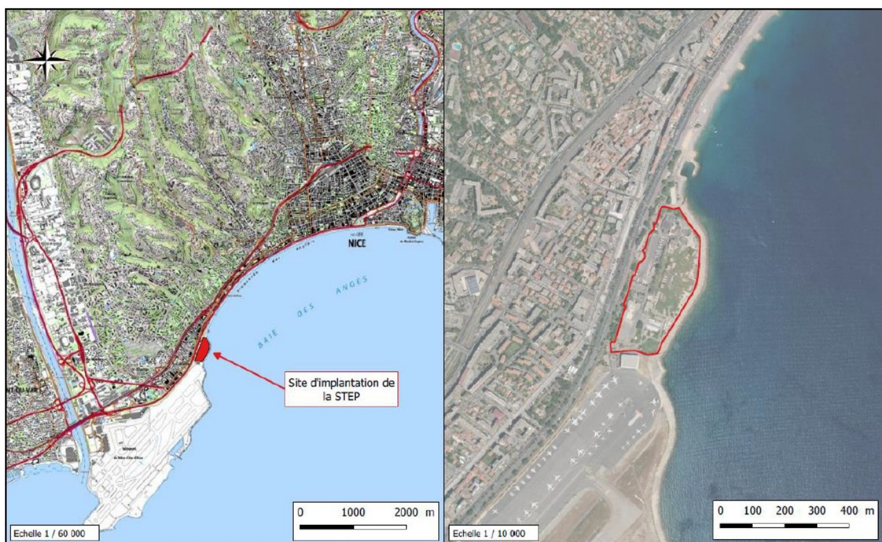
Figure 1: Localisation du projet de reconstruction de la station d'épuration

La commune de Nice, située dans le département des Alpes-Maritimes, compte une population de 342 669 habitants (recensement INSEE 2019) sur une superficie de 72 km 2 . Elle est comprise dans le schéma de cohérence territoriale (SCoT) de la Métropole Nice Côte d'Azur, en cours d'élaboration et regroupant 51 communes. Le plan local d'urbanisme métropolitain (PLUm) de Nice Côte d'Azur a été approuvé le 25 octobre 2019.